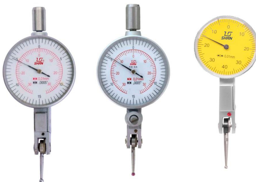
Рисунок 2 – Общий вид индикаторов модели ИРБ