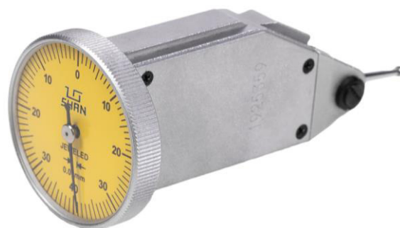
Рисунок 3 – Общий вид индикаторов модели ИРТ