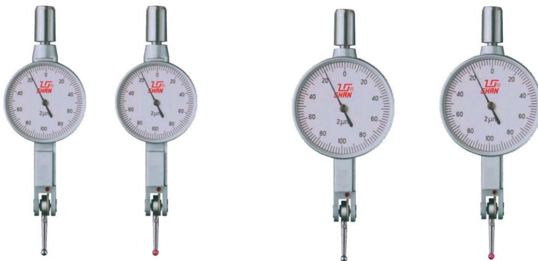
Рисунок 1 – Общий вид индикаторов модели ИРБ

Цвет шкалы может отличаться от представленных на рисунках 1-4 и не влияет на метрологические характеристики индикаторов.