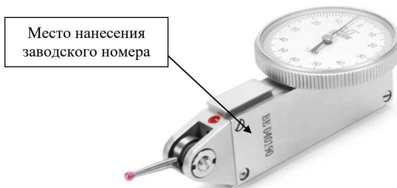
Рисунок 5 – Место нанесения заводского номера