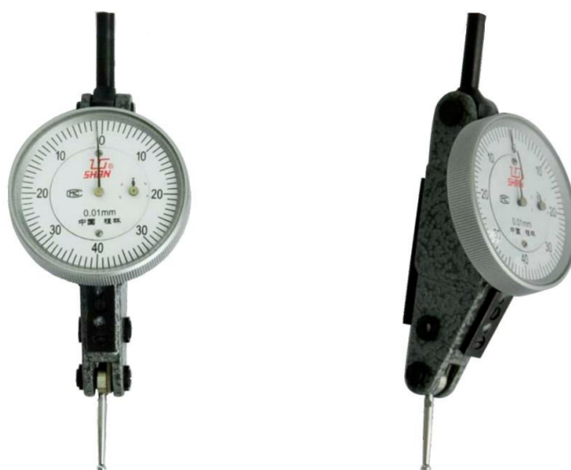
Рисунок 4 – Общий вид индикаторов модели ИРБУ