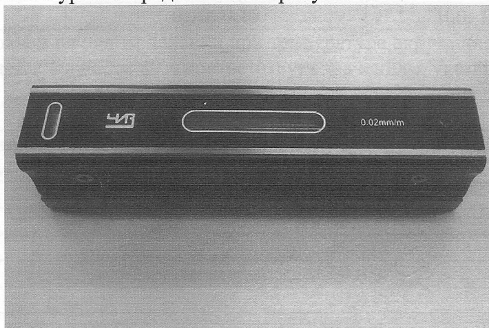
Рисунок 1 – Уровень брусковый.

Внешний вид рамного уровня представлен на рисунке 2.